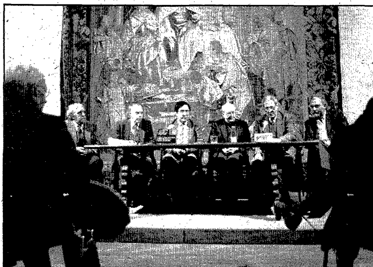
Un moment de la presentació ahir a la Fontana d'Or.

Ahir, a la Fontana d'Or, de la Caixa d'Estalvis Provincial de Girona, es va presentar el llibre com el resultat de la tenacitat i erudició del grup d'investigadors que han fet un treball que es troba al millor nivell europeu: «Aquest volum no és estrictament una iniciativa de l'Institut d'Estudis Catalans, sinó que respon a un projecte de treball de la Unió Acadèmica Internacional. Econòmicament ha estat possible gràcies a l'ajut de les institucions de Girona i de la fundació Noguera».